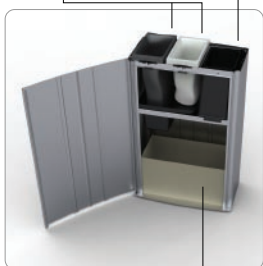
Oppsamlingskartong for papir

Papiret ledes gjennom trakten og samles i beholderen i bunnen