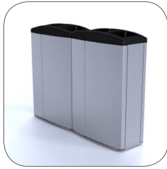
Monter i serie for flere fraksjoner