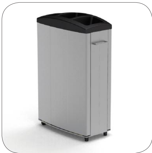
Håndtak og hjul for økt mobilitet